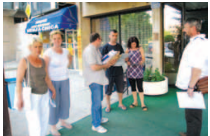
Расељени испред „привременог смештаја“

У причи стигосмо до колективног центра - хотела. Да се не зна повод доласка и структура становника, могло би да се каже идилична слика - "живот на високој ноzi". Споља сасвим пристојан хотел, испред жагор. Пуно људи, једни у ресторанском делу, други на клупама испред зграде. Једно пада у очи код обе групе, нико ништа не конзумира. Препознатљива група, расељени становници хотела, односно колективног центра. Напољу проводе време, а имају га на претек. Унутра