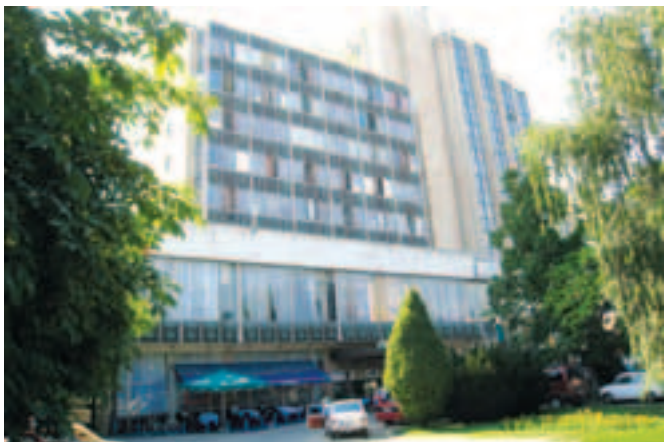
Споља зграда, унутра јадац

Њему, а и осталима са којима смо касније причали, нестварна делује прича да у Призрену могу слободно да се крећу и причају, па чак и са својим дојучерашњим комшијама Албанцима. Чули су да су се организовале “иди-види” посете, али због удаљености, до сада им нико није понудио да се укључе у ову активност. Обећавамо да ћемо са Данским саветом за избеглице