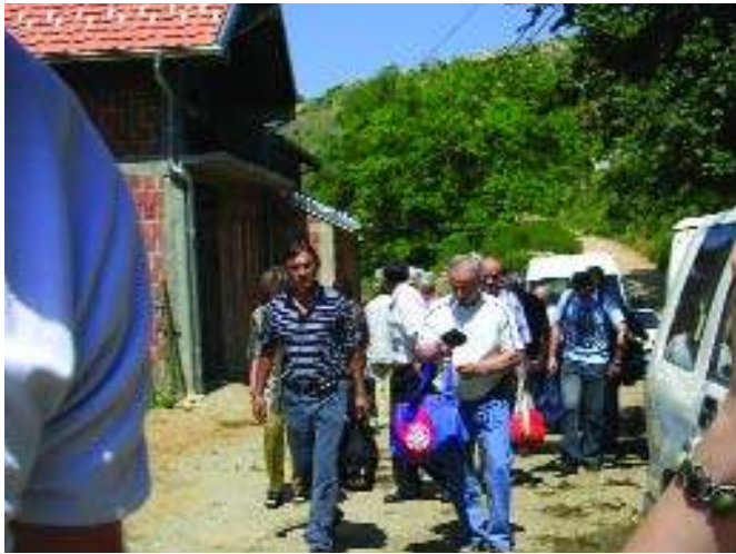
Долазак у Плањане

У иди-види посети учествовало је укупно 19 интерно расељених лица из села Плањане, која тренутно живе на подручју Србије, прецизније у градовима Краљево, Крагујевац, Београд, Јагодина, Горњи Милановац, Лапово и Чачак. У овој посети су, као организатори, учествовала и два лица из организације "ЈУГ", једно из организације "Сфиде", као и два представника донатора DRC-KIP . Циљ посете је био да се обиђе село, гробље, црква и куће. Расељени су разговарали са својим комшијама из села, представницима општинских власти Призрена, а обављени су и разговори са људима из ASB -а (организација која се бави реконструкцијом кућа), ради договора око обнове кућа за пет повратничких породица из села Плањане.