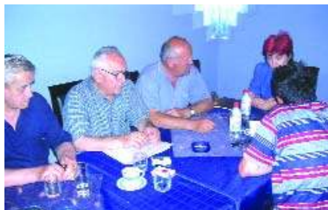
Разговор са расељенима из Рудника