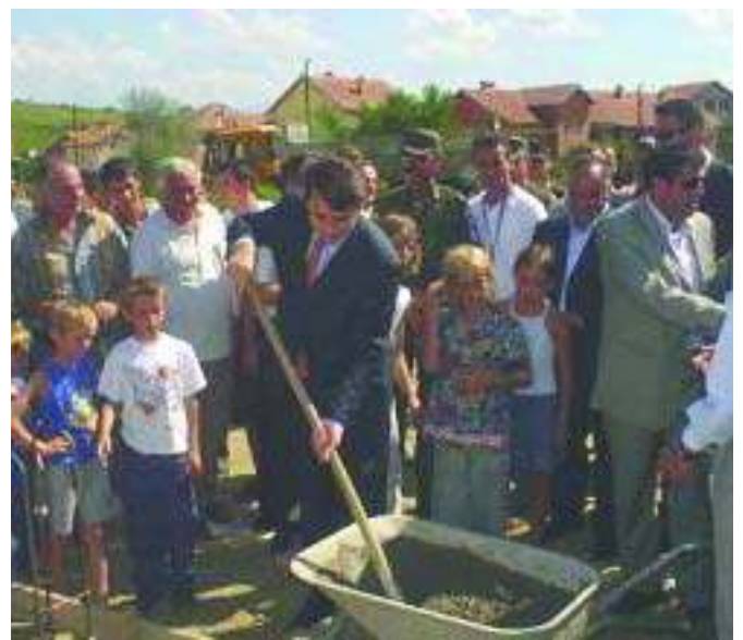
Несвакидашњи догађај на Косову и Међохији: Монаси манастира Зочиштије и премијер ПИС Владе Косова приликом полагања камена темеља за почетак изградње српских кућа у Зочиштију