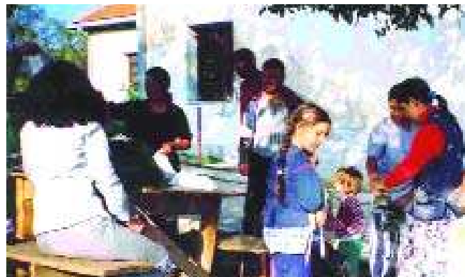
Из једног од колективних центара.

Лица која су се интегрисала, раде или се школују и њихови приходи потичу углавном од сопственог радног ангажовања. Будућност везују за останак у новој средини, а информисаност о догађајима из нове средине код њих углавном има већи значај. Занимљиво је да су боље интегрисана расељена лица која су живела на селу. Могуће је да разлог лежи у навикнутости на скромније услове