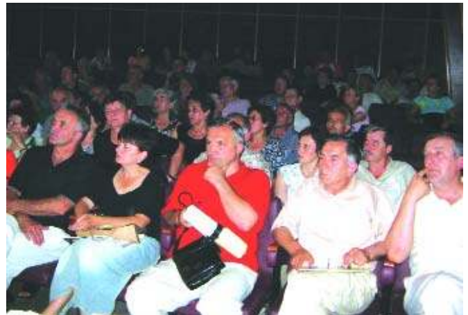
Расељени Призренци у Крушевцу

представници КFOR-а су поднели званичну процену да не постоје сметње за повратак расељених, председник општине Призрен је јавно позвао расељене да се врате) након дискусија и предлога за допуну, усвојила предложен Концепт папир за повратак у Призрен град. То је уједно и први усвојен Концепт папир једне локалне невладине организације са простора Србије. У наредном периоду предстоји изналажење донатора за подршку овог Концепта, склапање споразума са партнерима, класификација, одабир повратника, и почетак реконструкције. Подршку у процесу реализације Концепт папира Удружење "Свети Спас" поред своје канцеларије на