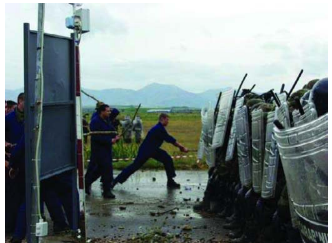
Учесници војне вежбе Поносни орао у демонстрацији спремноности заштитице светиња на Косметију