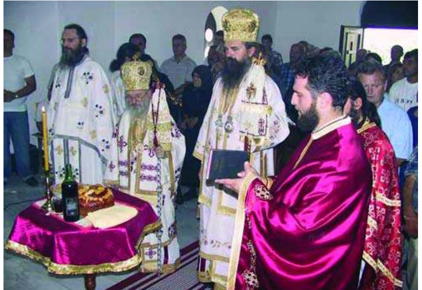
Осојане, август 2005. године.