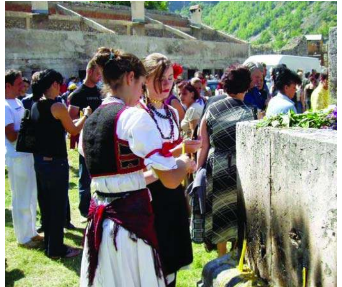
Манастирска слава у Светим Арханђелима, јул. 2005. године