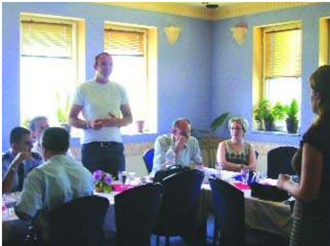
Уводна реч организатора посете

Организовање посете имало је вишеструку корист, како за саме организаторе, тако и за будуће повратнике у село Плањане. Оно што је посебно битно, а што представља крајњи резултат посете, јесте договор који је постигнут између пет повратничких породица и организације ASB о брзом почетку радова на реконструкцији њихових кућа. Ова посета представља само почетак када је у питању повратак и обнова кућа за људе из села Плањане обзиром да се планира још једна оваква акција у скоријем периоду, а добар показатељ оваквих иницијатива, видљив је из одлуке расељених да се још седам породица врати у село Плањане.